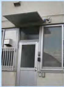
アルミ庇・人感センサ付LED照明器具取付け