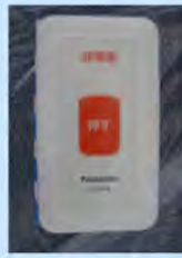
緊急通報装置の取付け