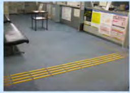
誘導タイルの貼り替え