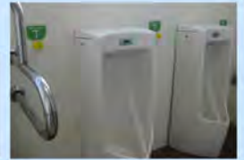
杖吊り器具の取付け