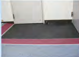
Pタイルの貼り替え

庁舎内の改修工事を行いました。勝手口へ庇と人感センサ付ライトの設置、緊急通報装置の設置、男性用トイレへ杖吊り器具の設置、床材の改修等を、業務に支障のないよう休庁日に1日で終わりました。